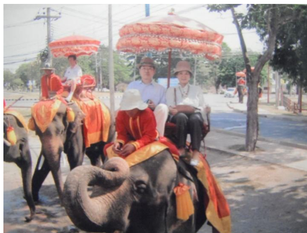
象に乗っての遺跡巡りも再開されていました。