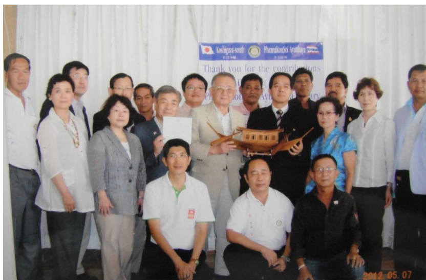
アユタヤRCの皆様・越谷南RC会員・奥様

アユタヤRCの皆様は浸水の被害に遭われたものの家族は元気であることを確認し、安堵しておる次第です。】