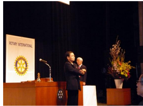
国歌斉唱・ロータリーソング斉唱