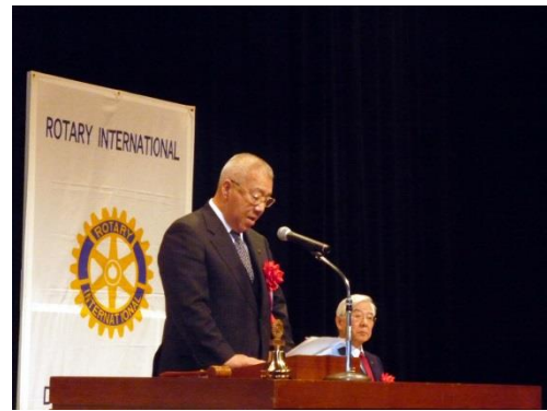
来賓挨拶（三郷市長）