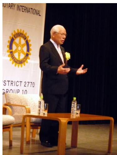
国際ロータリー直前会長田中作次様