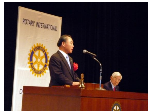
来賓挨拶（松伏町長）