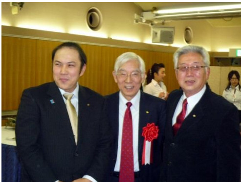
会員バッジの贈呈