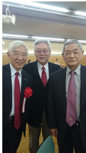
カウンセラーバッジの贈呈