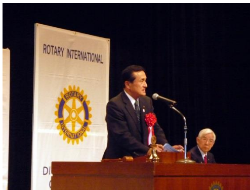
来賓挨拶（吉川市長）