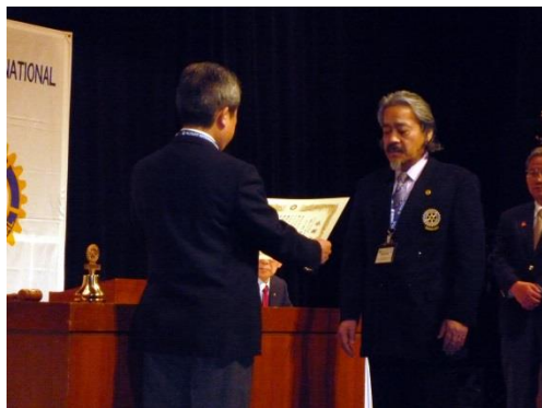
直前ガバナー補佐感謝状贈呈