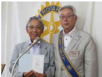
石塚会員 第8回マルチプル 当クラブ 第31回