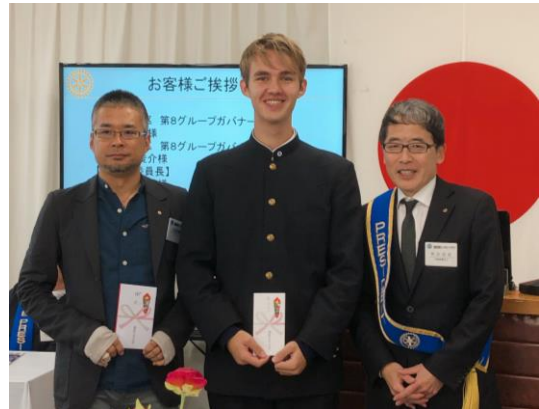
仁多見会員にホストファミリー有難うございます。