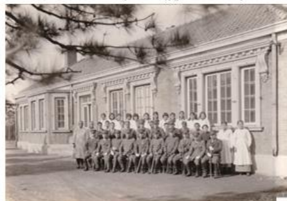
独立国 満州国の5万人の軍隊の一部局