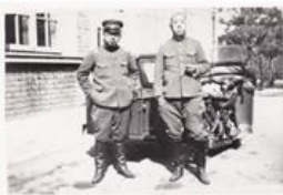
それなりに厳めしい風貌