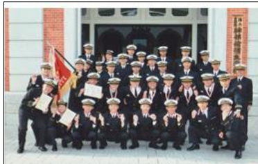
昭和59年 大学卒業と同時に 防衛庁 海上自衛隊 薬剤科幹部候補生採用