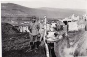
満州国軍衛生工廠では毎週何が行われていたか